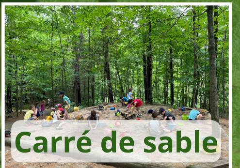
Carré de sable