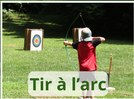
Tir à l'arc